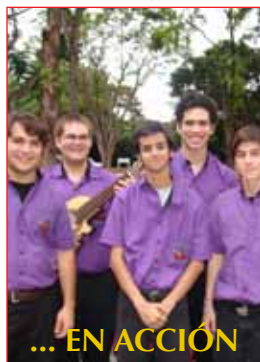
... EN ACCIÓN