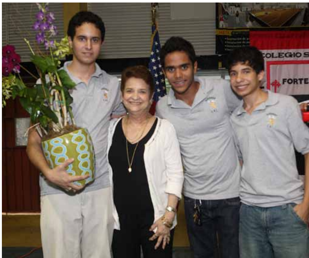
COLEGIO SAN IGNACIO DE LOYOLA