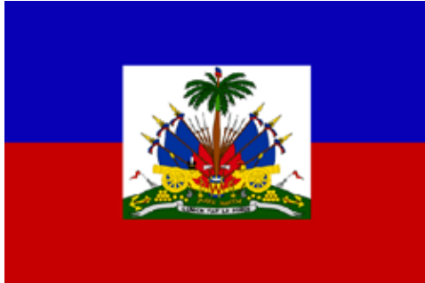
Bandera de Haití

“Ahora están sufriendo más pero antes también estaban sufriendo”