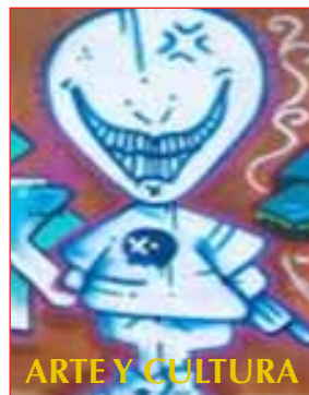
ARTE Y CULTURA